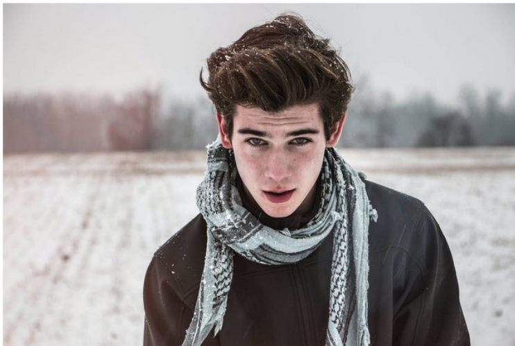
L'infoltimento capelli non chirurgico consente di sfoggiare una chioma leonina anche in caso di calvizie o alopecia, senza dover ricorrere al più invasivo trapianto